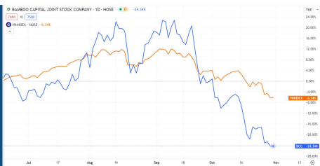
DIỄN BIẾN GIÁ CỔ PHIẾU TƯƠNG QUAN VỚI VN-INDEX